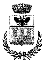
COMUNE DI MONTIGLIO MONFERRATO