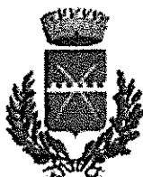
COMUNE DI CUNICO